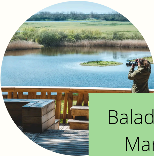
Balade au Parc du Marquenterre