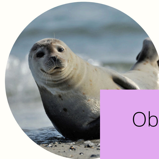
Observation des phoques