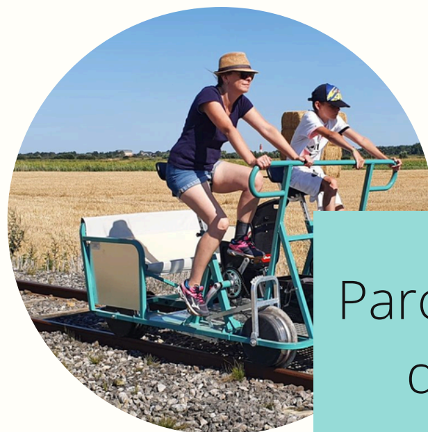
Parcours en velo rail depuis Cayeux