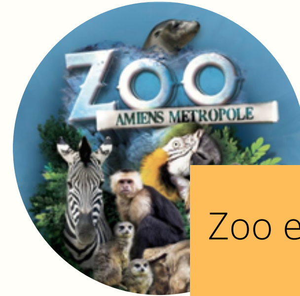
Zoo et escape game à Amiens