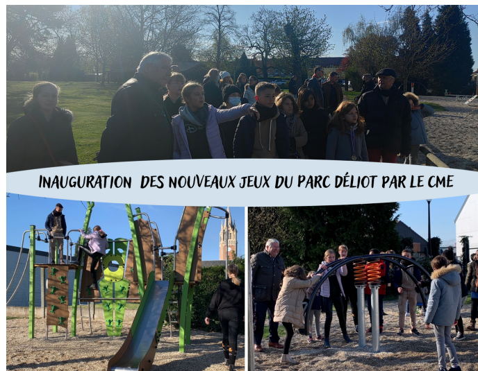
INAUGURATION DES NOUVEAUX JEUX DU PARC DÉLIOT PAR LE CME

Les beaux jours arrivent et c'est non sans fierté que les jeunes élus du Conseil Municipal des Enfants ont pu inaugurer les nouveaux jeux du Parc Déliot ce samedi 2 Avril 2022 en présence de Monsieur le Maire et des élus du Conseil Municipal adulte.