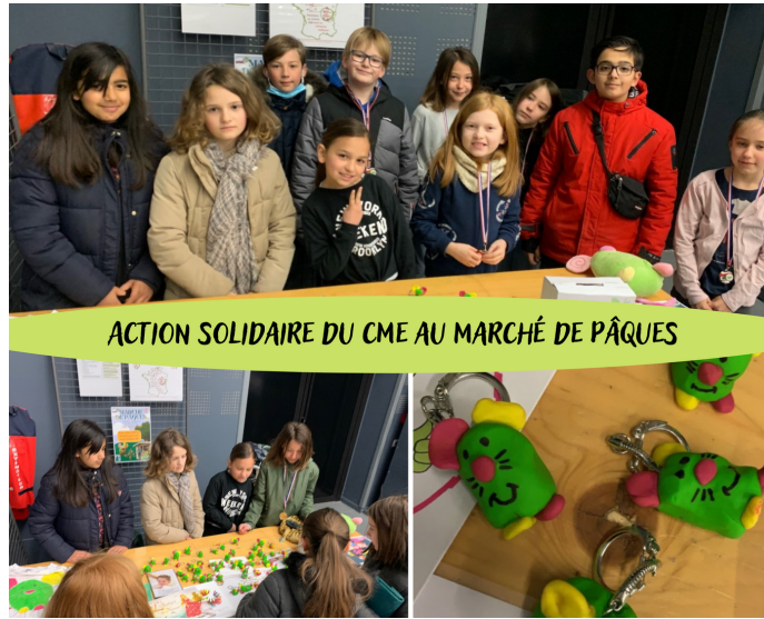
ACTION SOLIDAIRE DU CME AU MARCHÉ DE PÂQUES

Si vous êtes passés par le Marché de Pâques qui avait lieu à Agoralys le premier week end d'Avril, alors vous avez forcément croisé la souris V'Rett !