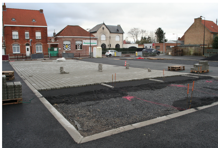
Finalisation des travaux du parking Agoralys