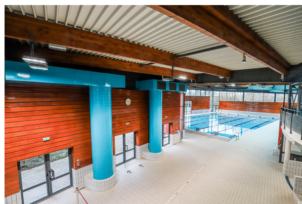
Travaux de peinture à callysia