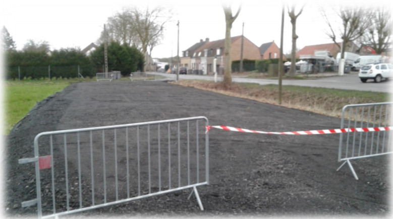
Création de parkings