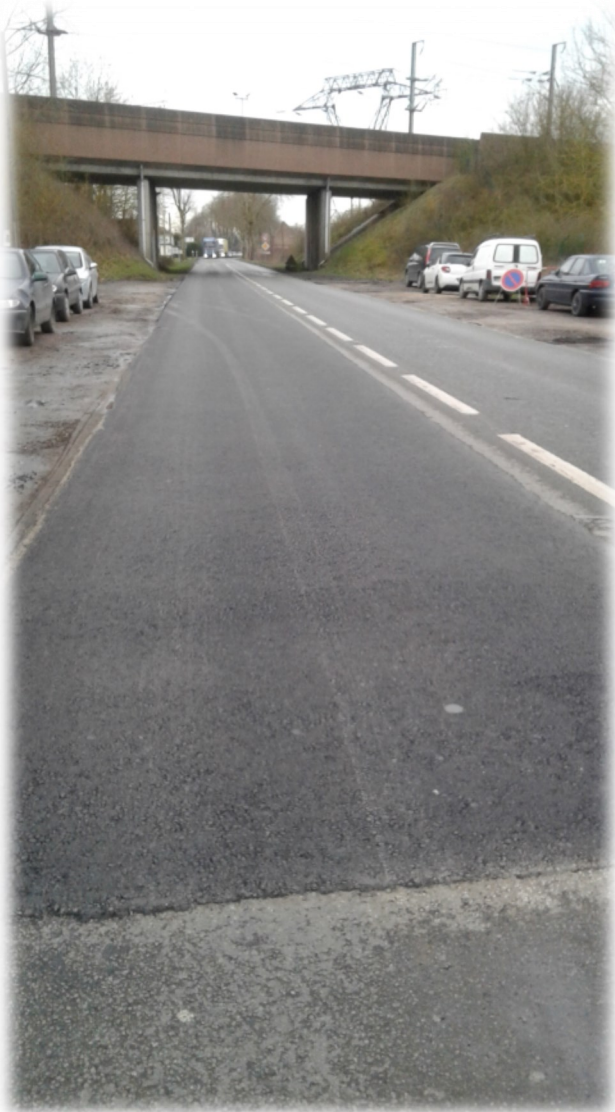
Réalisation de tapis d'enrobés